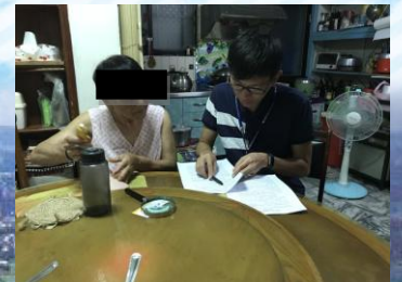
個管師與長輩講解照顧模組