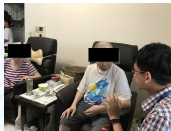
個管師與長輩講解照顧模組