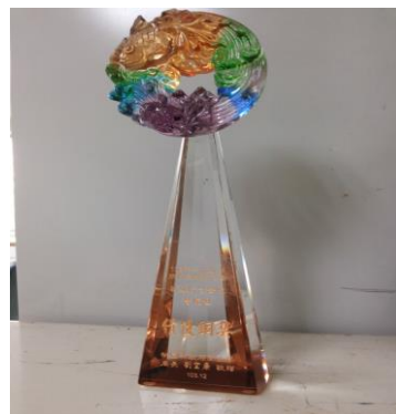
103 年度戒菸服務量競賽-銅獎