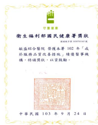
102 年戒菸服務品質改善措施-績優