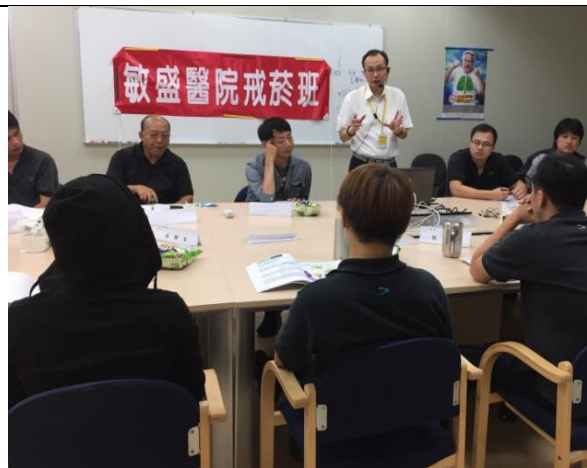
敏盛綜合醫院戒菸班