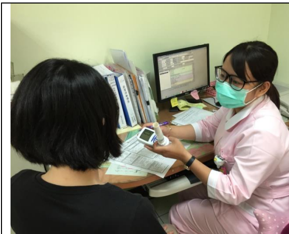
戒菸個管師戒菸衛教諮詢