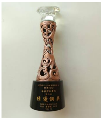
105 年度戒菸服務量競賽-銅獎